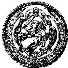
Герб Нюена, 1642 г.

В ходе военных операций Северной войны русские войска вошли в 1702–1703 гг. в Ингерманландию. Шведы потеряли две важные крепости на Невском водном пути, соединяющем Ладожское озеро и Финский залив. В октябре 1702 г. русские захватили Нетеборг в верховьях Невы. 1 мая 1703 г. в устье Невы на берегу Охты пала крепость Нюенсканс (швед. Skansen vid Nyenfloden , фин. Nevanlinna , нем. Newaschanze , голланд. Skanz ter Nyen , рус. Нюешанц , Канец ) вместе с городом Нюен ( Huen ). После захвата последнего, 16 (27) мая 1703 г., царь Петр Великий решил построить на берегу Невы крепость Петра и Павла, а через некоторое время и город у ее стен – Санкт-Петербург. 1 Тем самым Петр обеспечил России выход в Балтику или, образно говоря, «прорубил окно в Европу». Строительство Петербурга стало важным историческим событием не только для России, но, шире, для всех стран Балтийского моря и для Нидерландов и Англии – первых морских держав того времени.